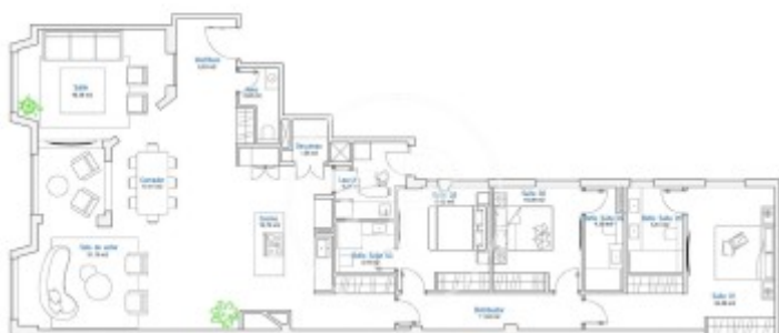
83. Estado reformado [2]