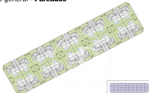
Plano general - Pareados