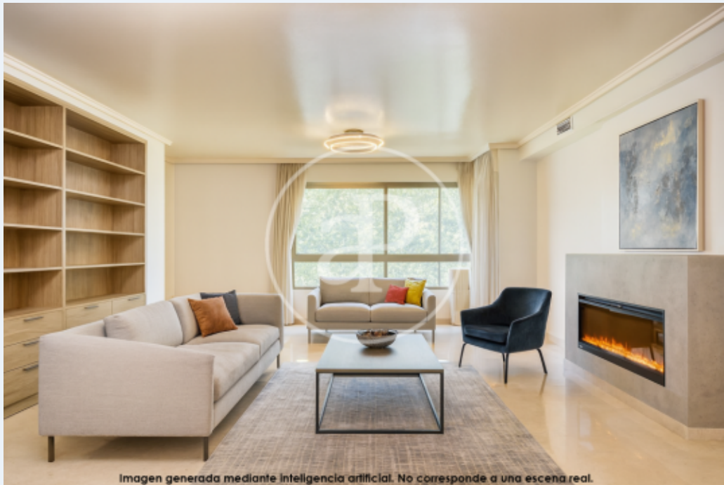
Imagen generada mediante inteligencia artificial. No corresponde a una escena real.

aProperties präsentiert diese außergewöhnliche Immobilie mit 196 m 2 laut Kataster, gelegen in einer der exklusivsten und gefragtesten Gegenden Valencias.