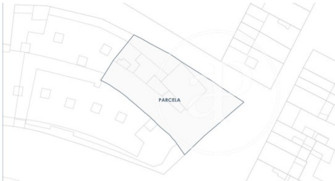
CUADRO URBANÍSTICO DE PARCELA (PGOU-98)